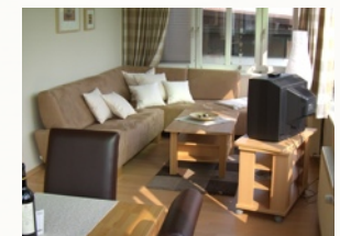
Telefon (deutsches Festnetz) & Internet (WLAN) inclusive