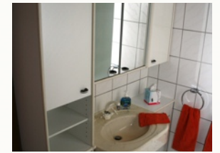
Bad mit Dusche & WC Münz-Waschmaschine & Trockner