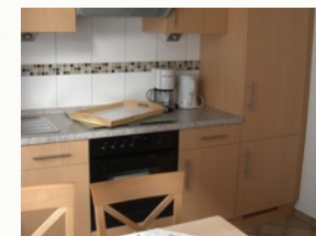
Komplett ausgestattete Küche